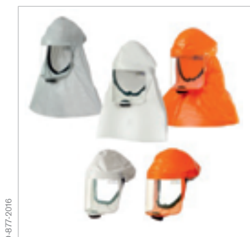
Cappucci Dräger X-plore® 7000

Grazie alla loro leggerezza i cappucci corti e lunghi Dräger X-plore® 7000 sono molto confortevoli anche quando vengono indossati per lunghi periodi. I cappucci sono consigliati per l'uso in aree in cui non è richiesta alcuna interfaccia meccanica o protezione per la testa al di là della protezione respiratoria. I cappucci corti e lunghi TH2 sono disponibili anche in arancione per ambienti di lavoro in cui la visibilità dell'utente è importante.