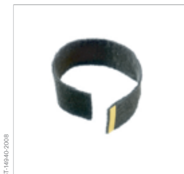
Filtro antiodori Dräger X-plore® 7300