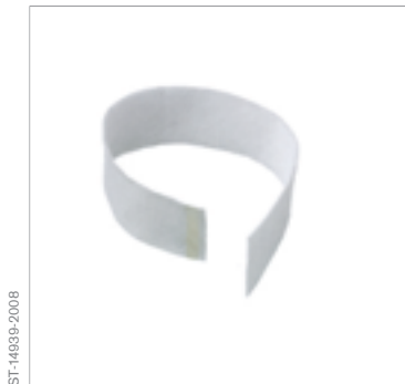
Prefiltro Dräger X-plore® 7300