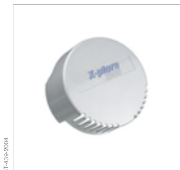
Coperchio filtro di ricambio Dräger X-plore® 7300